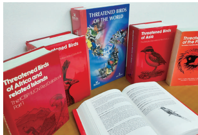
世界の絶滅危惧種を解説したRed Data Book

BirdLife International Japan Fund for Science基金は、バードライフが世界中で行う鳥類の保護や自然環境保護の基礎となる調査研究活動を支援することを目的とした基金です。2023年に5年間で3億円という初期の目標を大幅に上回る金額を達成することができました。2024年からは、本部の研究チームに毎年2,000万円を提供していきます。研究成果は、バードライフだけではなく、さまざまな国際機関や各国政府に基礎データとして提供されるとともに、IUCN(国際自然保護連合)レッドリストとして発表され、自然保護に役立てられています。2023年は、大阪と東京で開催したガラ・ディナーの収益金から一部を充当しました。また、コーポレート・パートナーのショパールジャパン株式会社を始め、個人や団体、企業からも多額のご寄付をいただきました。