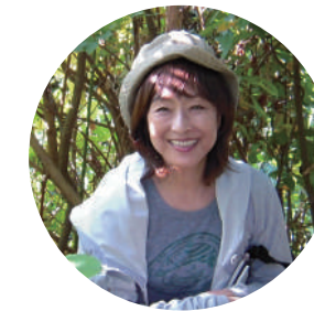
2024年1月 バードライフ・インターナショナル東京 代表理事

昨年は、TNFDのガイドラインが公表され、生物多様性の保全がますます重要視されるようになりました。バードライフの保全活動や生物多様性評価はより大切になっております。バードライフ東京も、世界中のパートナー団体と力を合わせ、地球温暖化の防止や生物多様性の保全に取り組んでいます。