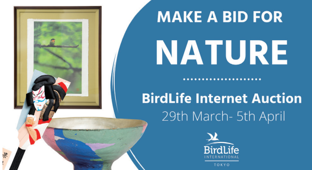
インターネット・オークション