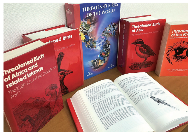
世界の絶滅危惧種を解説したRed Data Book