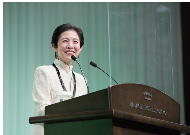
お言葉を述べられる名誉総裁 高円宮妃久子殿下