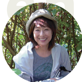
2022年1月 バードライフ・インターナショナル東京 代表

昨年につき2021年も新型コロナウイルスの影響には大きなものがありました。いくつかの助成事業が見送られた他、チャリティー晩餐会のうちの一つは、オンラインでの開催となりました。一方でSDGsを重視する企業等からの新規のご支援も実現しました。環境問題は深刻さを増しています。私たち、バードライフ東京は、今できること、求められることを模索しながら活動を続けてまいります。