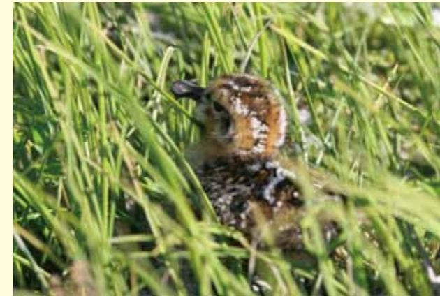
A newborn chick of the Spoon-billed Sandpiper in Chukotka, Russia 北東ロシアのチュコーツカで生まれたばかりのヘラシギのヒナ

ヘラシギは世界中にもっとも広く分布している絶滅危惧 I A 種のひとつです。したがってこの鳥を絶滅の危機からまもるためにアクションを起こすことは一大難事業といえます。幸い、アジアばかりでなく各地の人々が関心をもつようになり、新規のプロジェクトや資金集めの活動が始まっています。バードライフ・アジア・パートナーシップでも、2001年に『アジア版鳥類レッドデータ・ブック』にヘラシギ保護に関して最初の包括的な