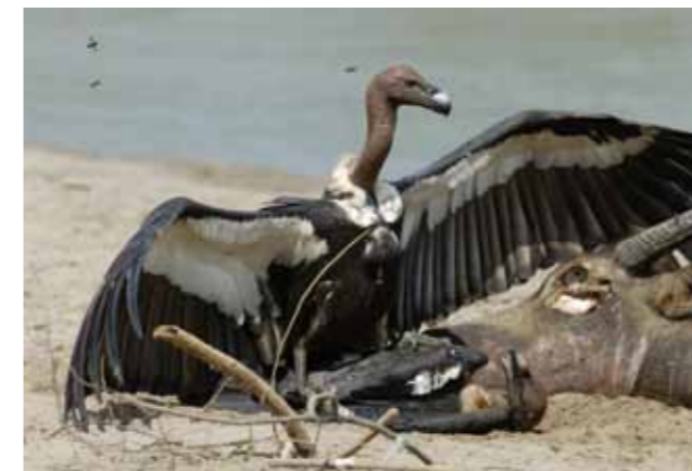
Asian vultures will be extinct in the wild within a decade unless urgent action is taken. 緊急に対策が取られない限りアジアのハゲワシ類は10年以内に野生では絶滅する可能性があります。写真はインドハゲワシ

You can find the full text of BirdLife's position on Conservation and Rights at http://www.birdlife.org/action/ground/conservation-rights/index.html