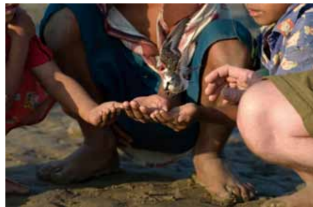
A Spoon-billed Sandpiper which had been treated its injury in captivity was released in Khok Kham, Thailand. 越冬地のタイ・コッカムで怪我をして保護されていたヘラシギが放鳥されたところ

BirdLife is grateful to the many organisations and individuals that have supported our work on SBS, including WildSounds and Heritage Expeditions (the Species Champions for SBS under the PEP), the David & Lucile Packard Foundation (for support in Russia) and Disney Friend for Change (for support in China).