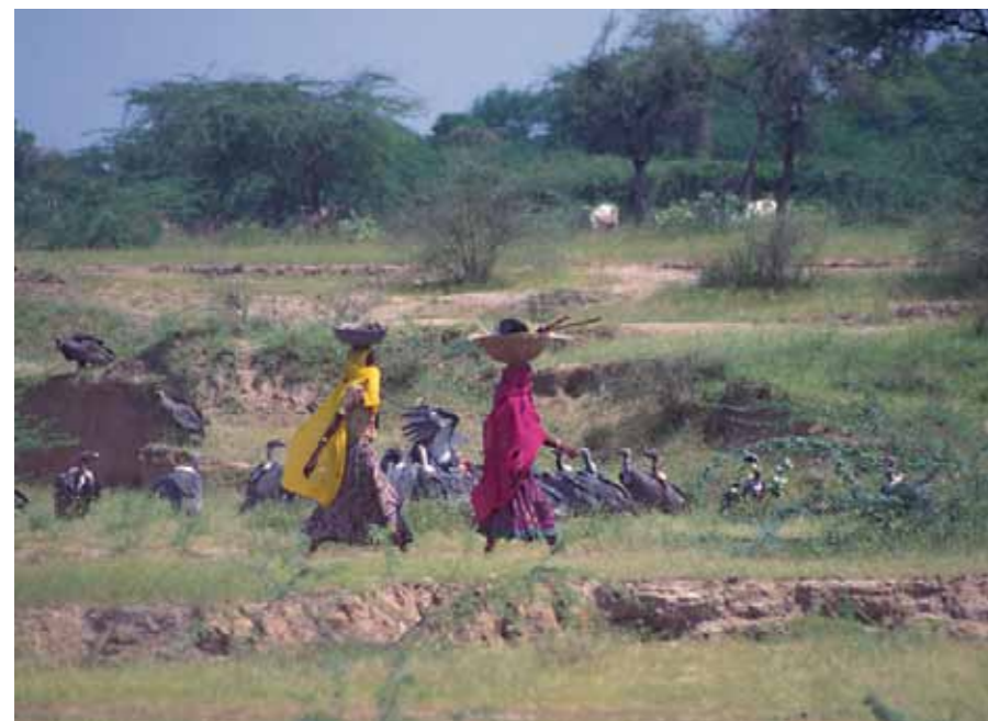
Local people passing in front of a flock of vultures ハゲワシの群れの前を通る地元住民

有効な予防処置を欠いた保護活動は人権を '害する' 危険性があります。保護活動は往々にして自然資源の利用や管理の方法に変化をもたらすことがあります。あまりにも厳格な環境保護は人々を考慮せず、現実的な代替物を与えずに彼らが依存している資源を奪ってしまうことがあります。人権に配慮したプロジェクトの採用はこのような状況を見極め、防止し、あるいは解決する助けになります。方針決定のプロセスは決定するに際して人々の発言