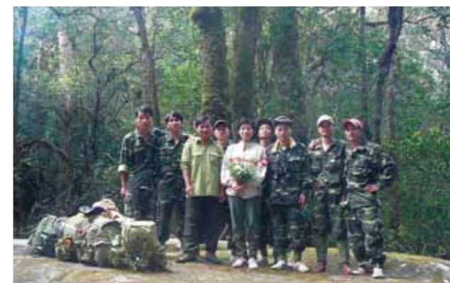
Conservation and research team members of BirdLife International Vietnam Programme バードライフ・インターナショナル・ベトナム・プログラムのチームメンバー

Key staff in Birdlife Vietnam Programme acknowledged that the process would be a daunting task given the country's not fully developed legal system and the current global economic down-turn. However, they strongly believe that this is the way forward!