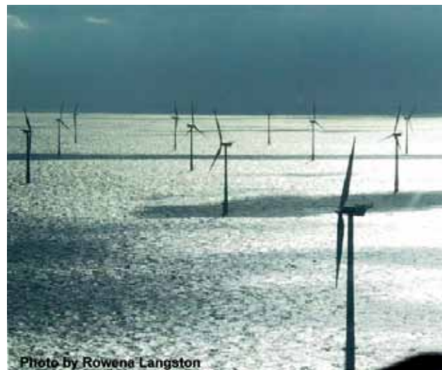
Marine-based wind power stations in Horns Rev, Denmark, one of the world's largest stations.